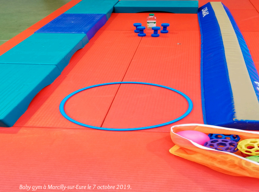
Baby gym à Marcilly-sur-Eure le 7 octobre 2019.