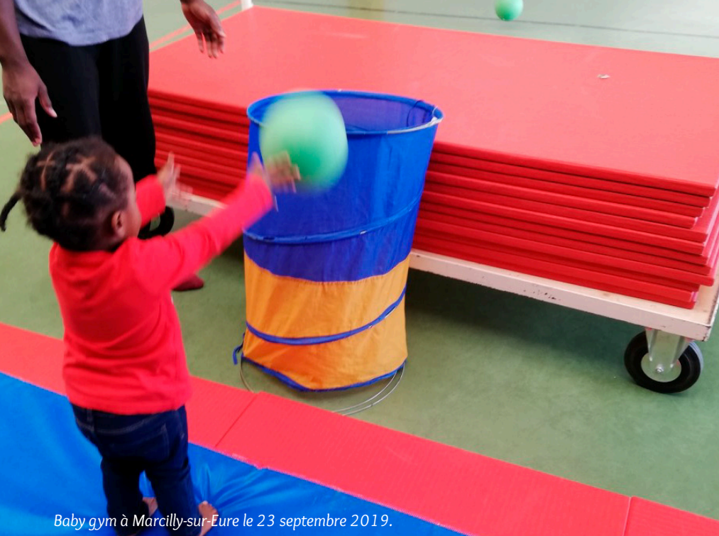
Baby gym à Marcilly-sur-Eure le 23 septembre 2019.