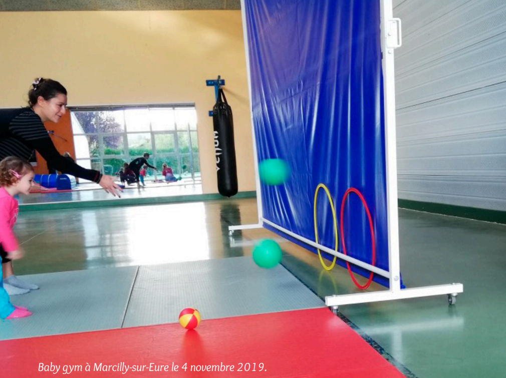
Baby gym à Marcilly-sur-Eure le 4 novembre 2019.